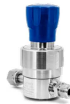
RX4000 単段式ダイヤフラム 1/2"

21/117/207/240 bar (305/1,700/3,000/3,500 psig)