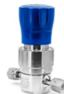
RX3200 単段式ダイヤフラム 1/4"