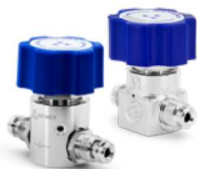
RX04 & RX04F