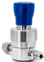
RX4200 単段式ダイヤフラム 1/2"

21/117/207/240 bar (305/1,700/3,000/3,500 psig)