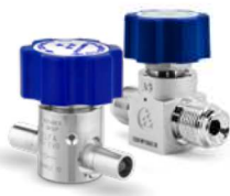
RX08 & RX08F