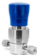
RX3000 単段式ダイヤフラム 1/4"